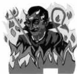
Equip Reallitat 314/EI Temps