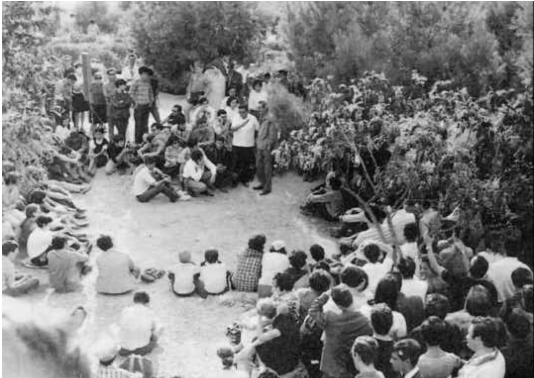
Els "aplects de la joventut". El Primer Aplec de la Joventut es celebra a Lliria l'any 1960. El segon "aplec" (1961) es celebrarà a Alcoi, i el tercer a Castelló (1962), etc. A partir de 1967, serian controlados estrechamente por la policia.