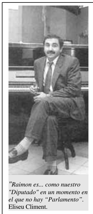
"Raimon es... como nuestro "Diputado" en un momento en el que no hay "Parlamento". Eliseu Climent.

El PSV promocionarà i difondrà les cançons de Raimon, com a instrument de difusió del valencianisme. Eliseu Climent li escrivia a un amic: "Raimon es el único valenciano conocido por España. Lo digo por que lo he visto. Sin saberlo es algo así como nuestro "Diputado" en un momento en el que no hay "Parlamento".