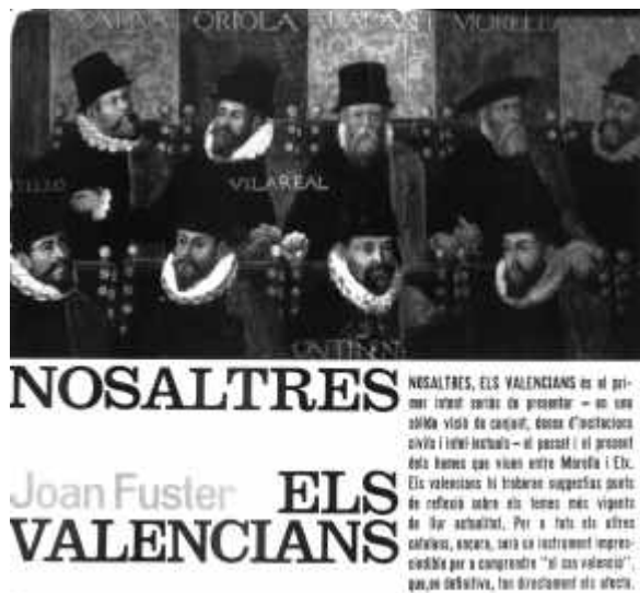
Portada de la edició 1962.

Les detencions massives de comunistes en 1962 desarticulen el PCE a València i enderroquen l'organització universitària que havia anat creant-se després de les detencions de 1959. Aquest fet serà decisiu per a que els joves valencianistes socialistes ocupen casi tot l'espai d'oposició al SEU i al franquisme a la Universitat de València durant els anys 1962 al 1965.